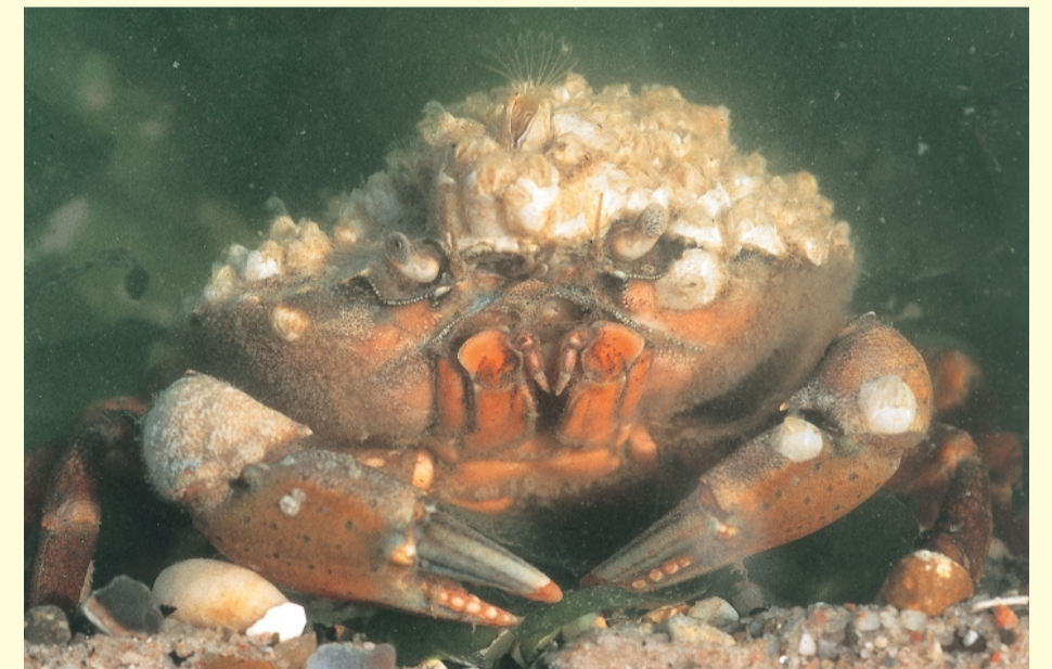
Krab begroeid met zeepokken

zandbanken aanwezig. Ze vormen vaak ware onderwatermuren, die – op één uitzondering na, de Broersbank t.h.v. Koksijde – net niet droog komen te liggen bij extreem laagtij. De grote hoeveelheid bodemorganismen die op deze zandbanken leven vormen een belangrijke voedselbron voor zee-eenden en voor vele vissoorten . Deze laatste zijn op hun beurt van groot belang als voedsel voor weer andere zeevogels . Daarnaast fungeren de zandbanken uitstekend als kraamkamer voor vele vissoorten en ongewervelden.